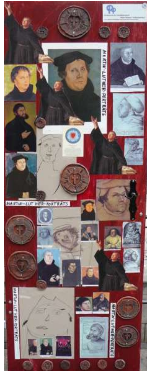
Luther-Thesenstür aus Wittenberg